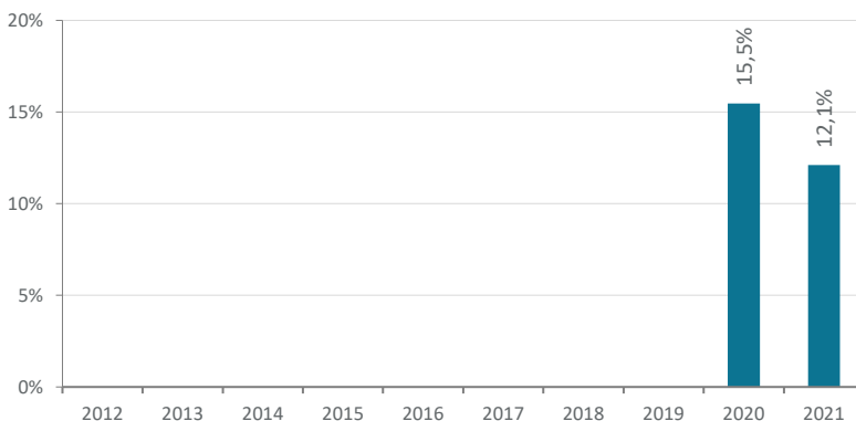
Roczne stopy zwrotu